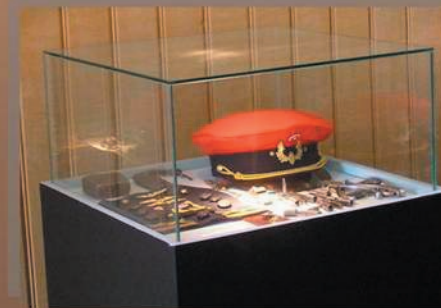
-liikenteenhoidon esineitä ja asuja