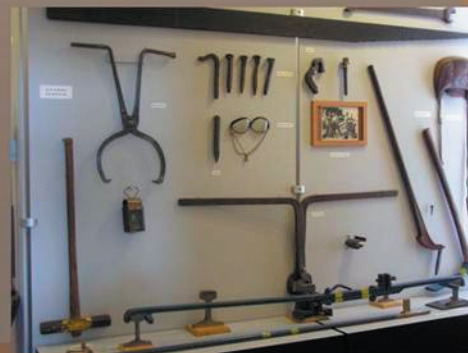
- nähtävillä erilaisia ratatyökaluja