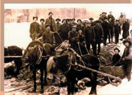
-vanhat valokuvat kertoo