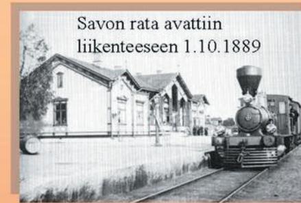
- vanhoja valokuvia liikenteestä