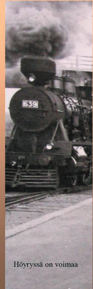
Höyryssä on voimaa