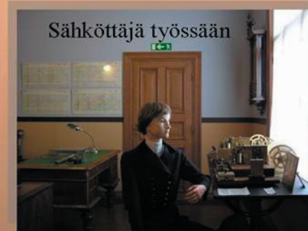
- luonnollisen kokoisia hahmoja