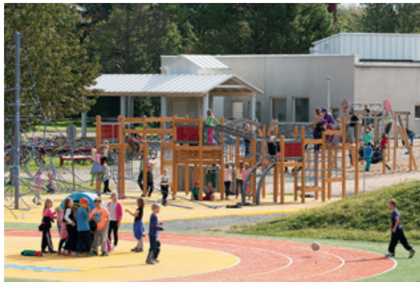
Syksyllä avattu Maaselän lähiliikuntapaikka palvelee läheisen koulun oppilaita, päiväkotilapsia, Kerttulassa asuvia ikäihmisiä sekä kaikkia Naarajärven taajaman asukkaita.

Toimintojen keskittämisellä yhdelle alueelle haetaan synergiaetuja, kun eri oppilaitosten ja hoivalaitosten toimijat kohtaavat. Säästöjä syntyy käyttö- ja tilakustannuksissa sekä henkilöstökustannuksissa. Yhteistyö ja osaamisen keskittäminen auttaa