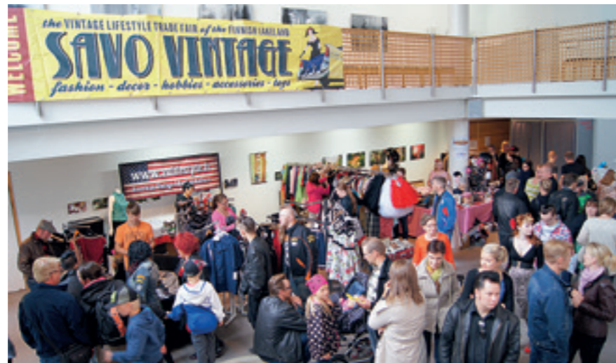
Savo Vintage -messut valloittavat Kulttuurikeskus Poleenin aulan ja näyttelytilat kesällä Big Wheels -tapahtuman yhteydessä.

Kaupungin parhaita tapahtumapaikkoja on myös Pieksäjärven ranta. Rantapuisto Kulttuurikeskus Poleenilta Hotelli Savonsolmulle tarjoaa puitteet perinteiselle Big Wheels –harrasteajoneuvotapahtumalle. Savonsolmun rannassa soi bluesmusiikki perinteikkäässä Savonsolmu Beach & Blues Partyssä.