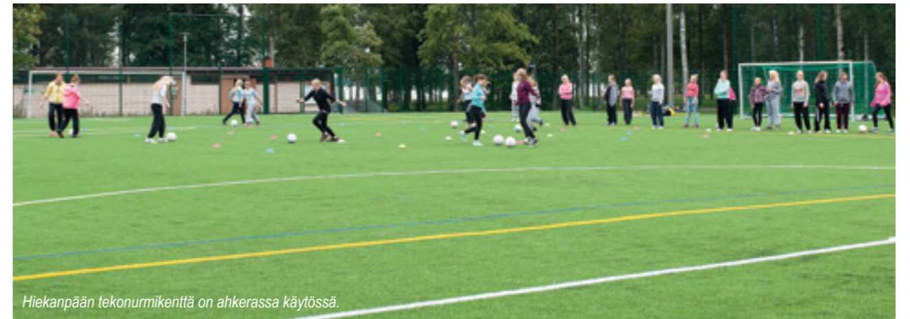
Hiekanpään tekonurmikenttä on ahkerassa käytössä.

Seuraavaksi lähiliikunta-alueella ryhdytään rakentamaan Harjun koulun pihalle. Myös Hiekanpään elämänkaariylien alueella on tehty mittava lähiliikuntasuunnitelma, joka toteutetaan alueen rakentamisen tahdissa.