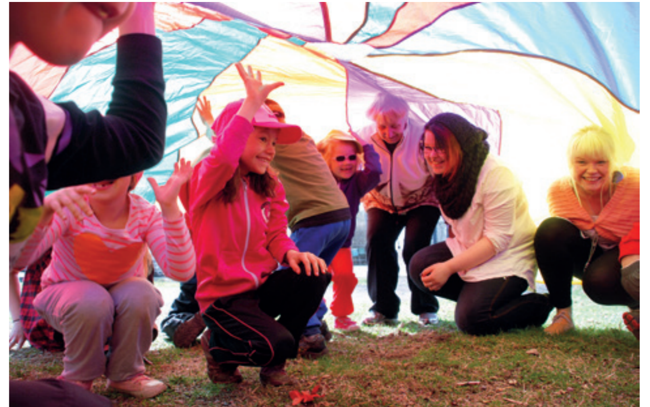
Elämänkaariylien eri sukupolvet ja erilaiset ihmiset sekä toimijat kohtaavat ja toimivat yhdessä.

myös synnyttämään uusia innovaatioita, kuten uusia koulutusaloja tai palvelukonsepteja.