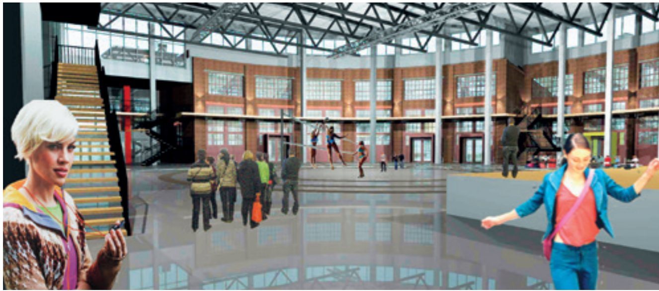
Veturitori valmistuu Vanhojen Veturitallien yhteyteen, aivan Pieksämäen keskustaan.