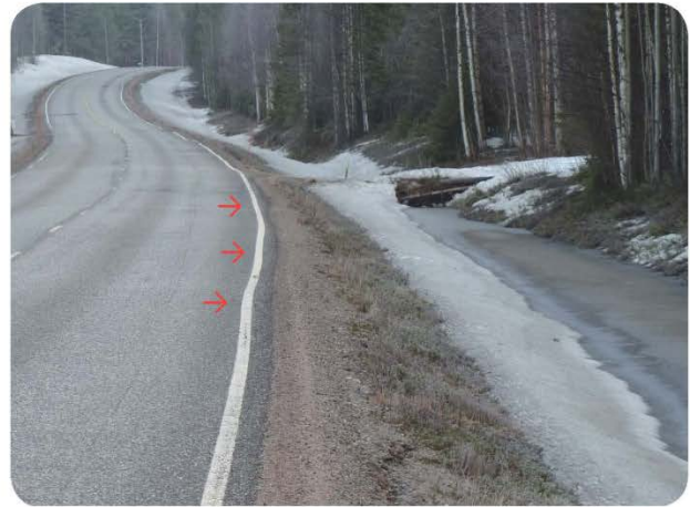
Mikäli veden virtaus estyy pitkään, imeytyy vesi tierakenteseen aiheuttaen esim. routaheittoja.