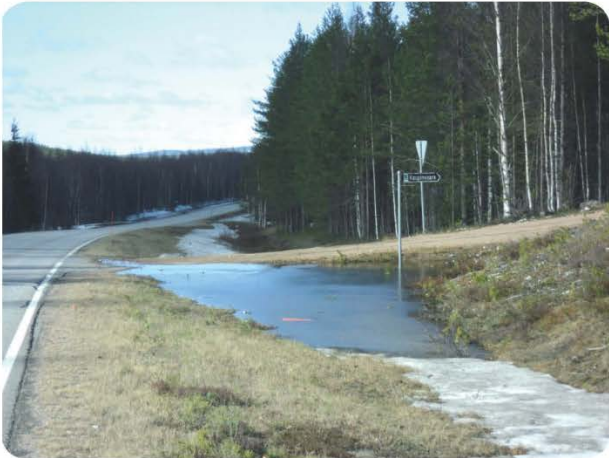
Jäätynyt rumpu estää veden virtaamisen ojassa ja vedet valuvat tielle.

Jos maantien varressa oleva rumpu on jäänyt ja sulamisvesiä on paljon liikkeellä eikä rumpua saada omin keinoin vetämään, voi rummun omistaja olla yhteydessä elinkeino-, liikenne- ja ympäristökeskukseen (ELY-keskus). ELY-keskuksen kautta voi tiedustella aukaisuun soveltuvan kaluston tilaamista paikalle. Sama pätee tilanteessa, jossa rumpuun on kulkeutunut runsaasti sen toimimista estävää lietettä. Toimenpiteistä aiheutuneista kustannuksista vastaa liittymän haltija.