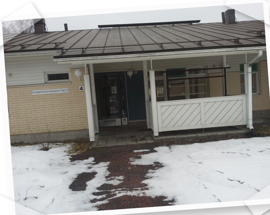
Lammenkukka talvella 2014

Lapset saavat hellää ja huolehtivaa hoitoa jolloin he ja vanhemmat kokevat tulevansa hyväksytyiksi ja tuntevat olonsa luottavaiseksi ja turvalliseksi.