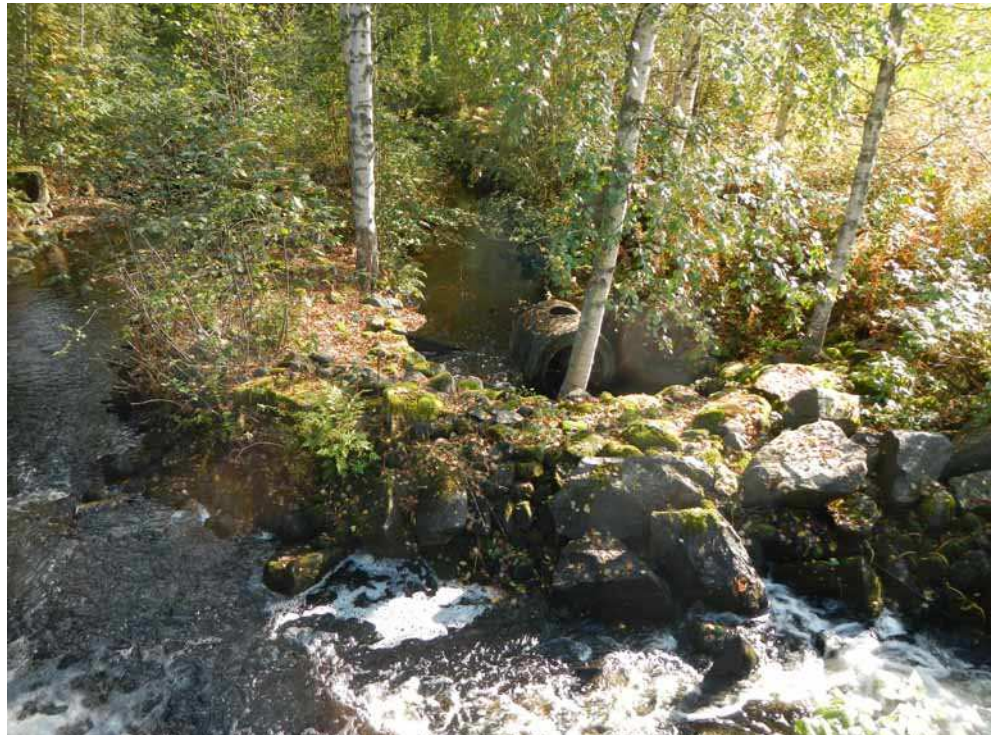
Kuva 48. Vesimyllyn rakenteita kuvattuna pohjoisesta sillalta. Turbiini koivun takana kuvan keskellä.