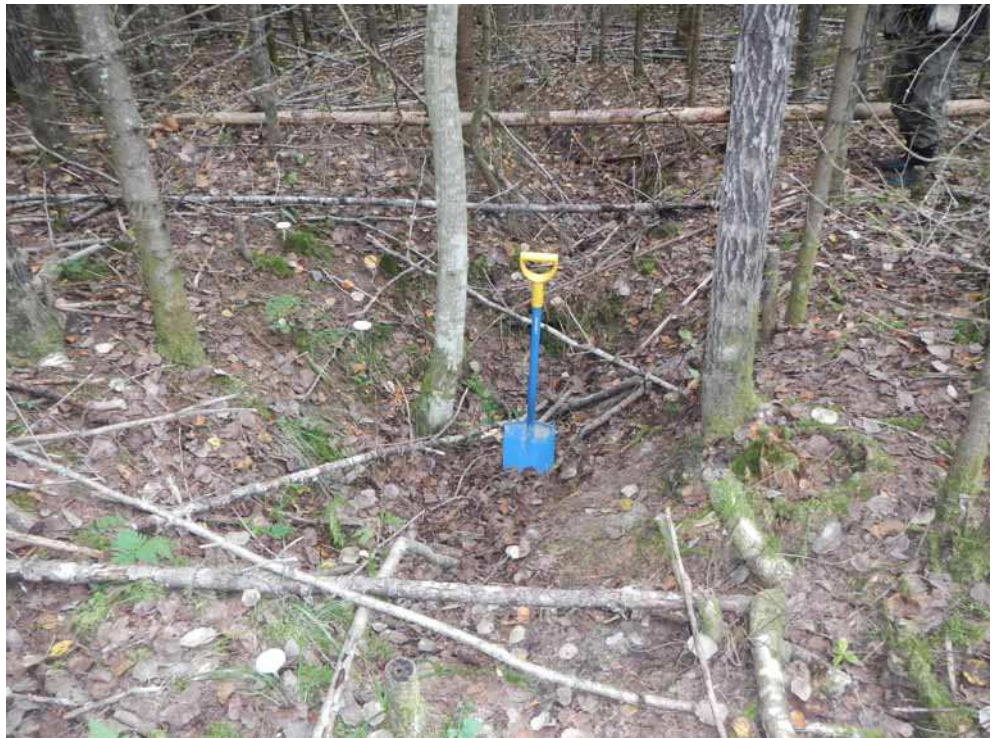
Kuva 52. Kuoppa C.