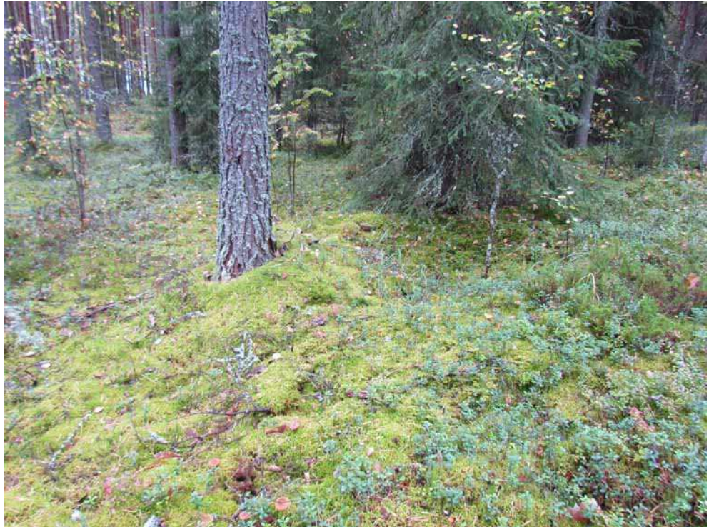
Kuva 6. Mahdollinen säilytyskuoppa 4 kuvattuna koillisesta.