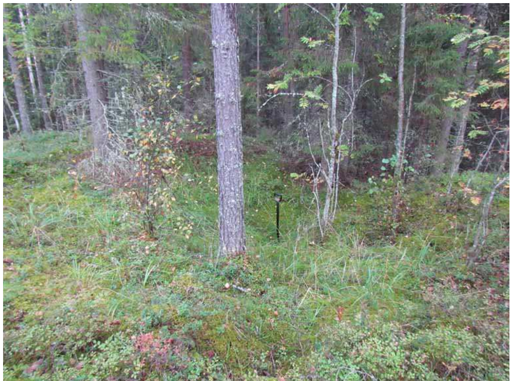
Kuva 12. Tervahauta 1 kuvattuna lännestä.