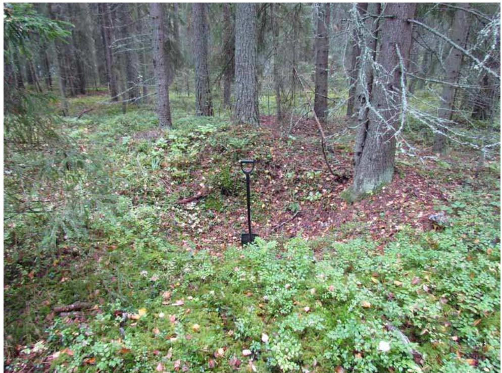
Kuva 21. Vuoden 2006 inventoinnissa löydetty hiilimiilu kuvattuna pohjoisesta.