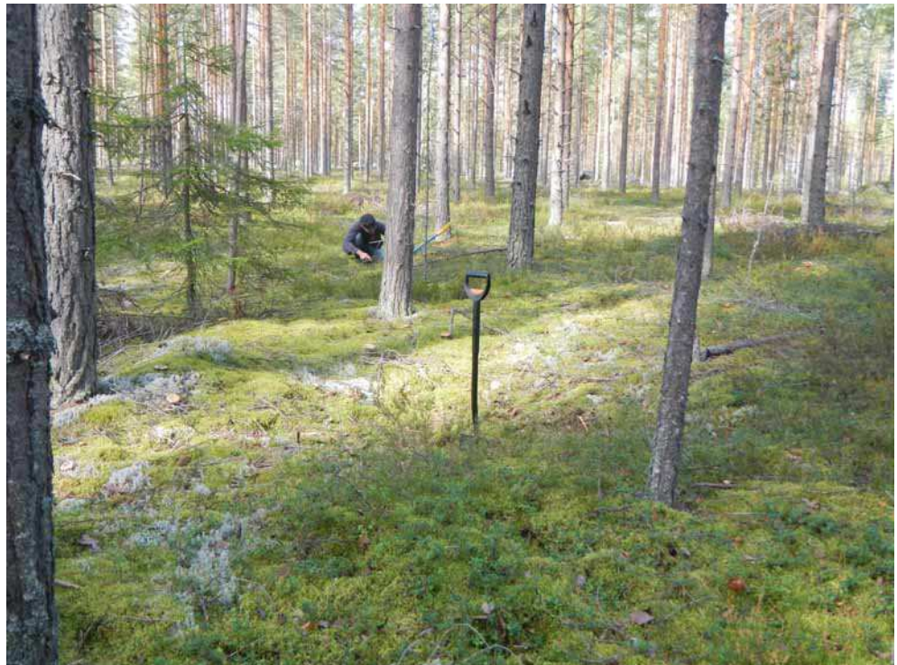
Kuva 37. Tervinlahden muinaisrantatörmällä sijaitseva painanne kuvattuna etelästä. Lappio painanteen keskellä, Markus Kankkunen tutkimassa kaivamansa koekuopan maannosta painanteen pohjoispuolella.