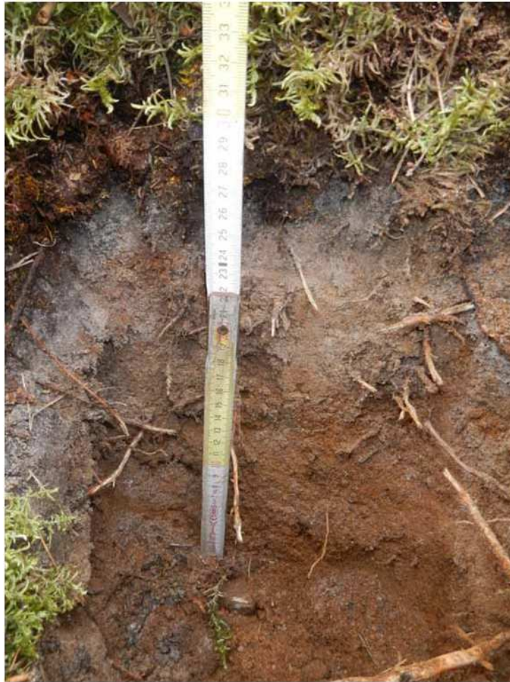
Kuva 44. Painanne A:han tehdyn koekuopan maannos.