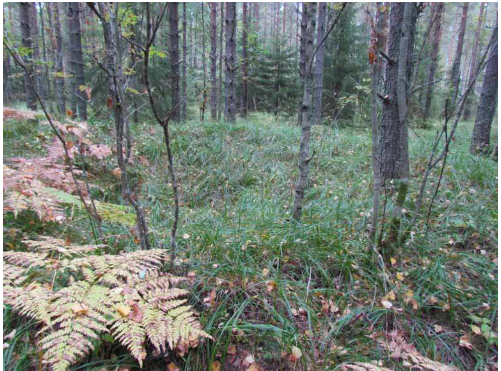
Kuva 10. Hiilimiilu 2 kuvattuna idästä.