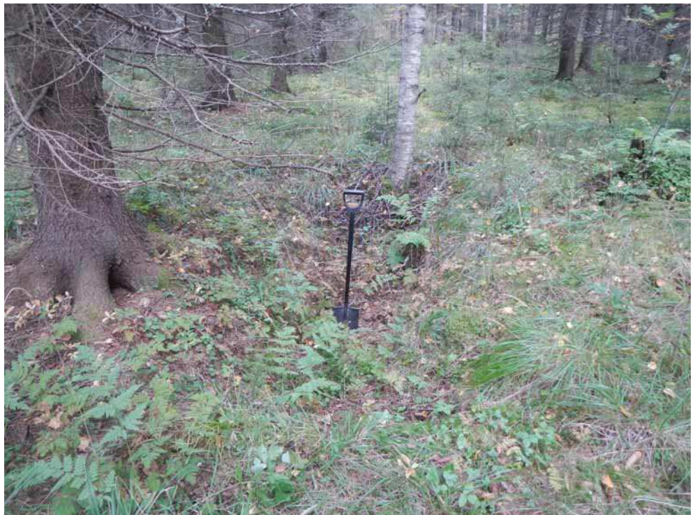
Kuva 42. Nauriskuoppa B kuvattuna idästä.