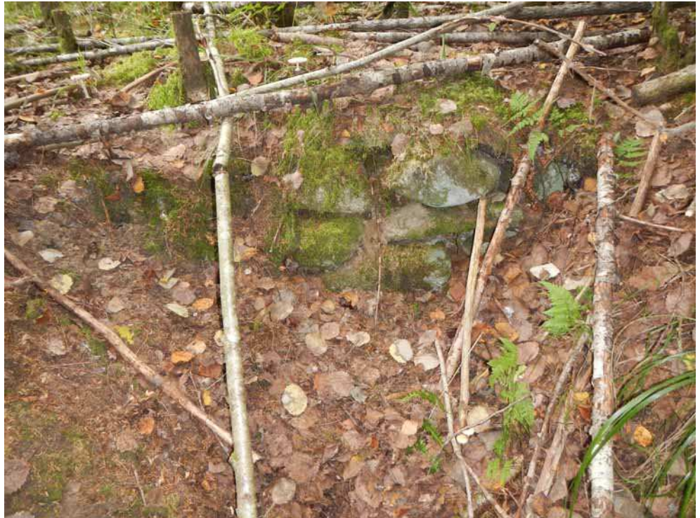
Kuva 53. Kiviä kuopan C seinämässä.