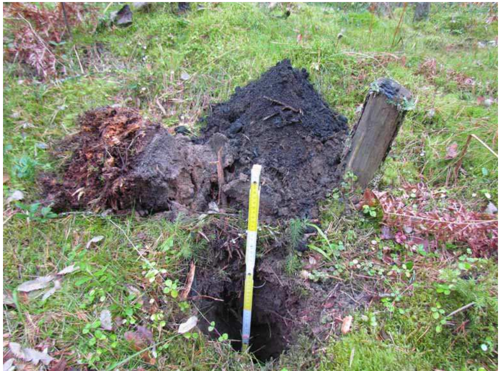
Kuva 26. Itäisimpään hiilimiiluun kaivetun koekuopan maannosta.