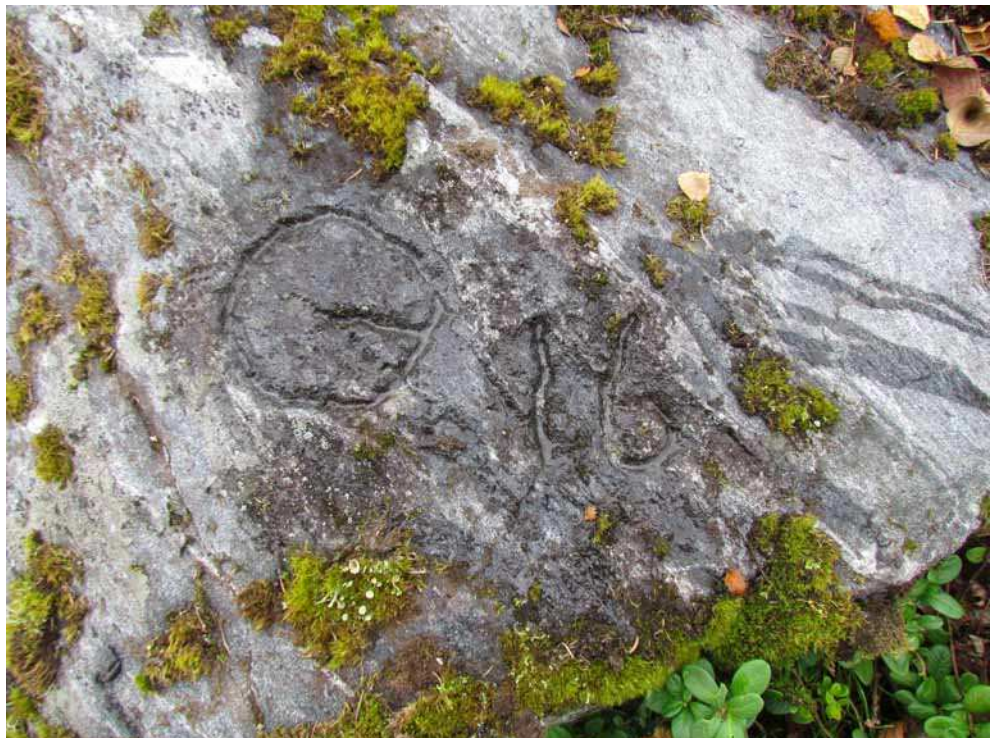
Kuva 58. Veneenvetopaikan itäpäässä sijaitsevan ja yhä käytössä olevan rajakiven hakkauksia.