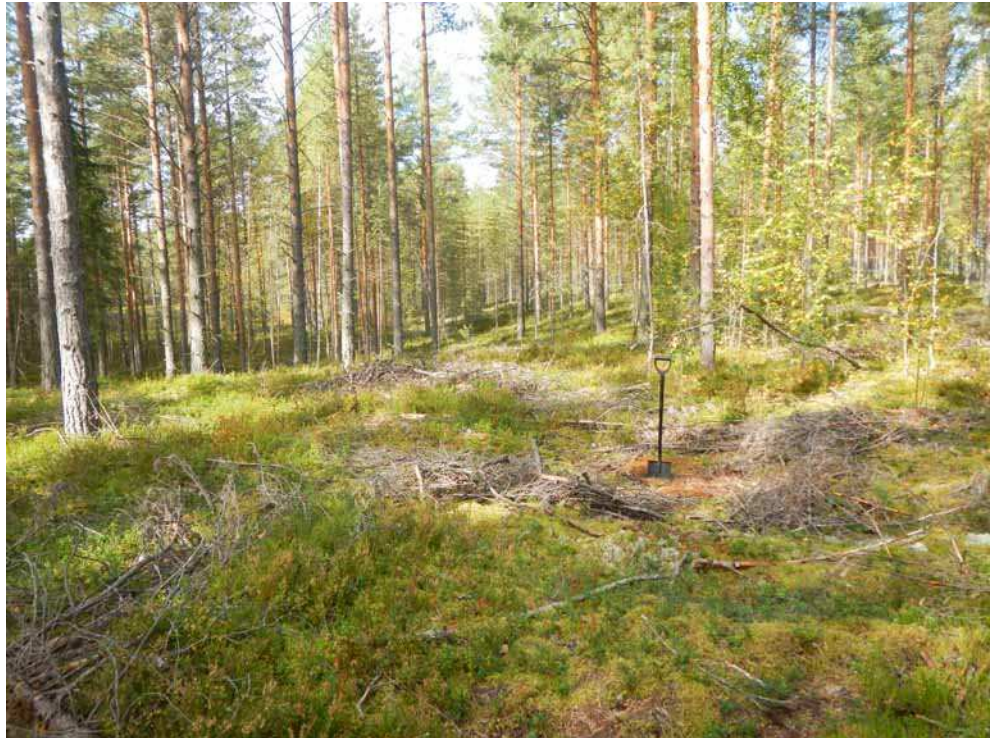
Kuva 35. Tinkinlammen pohjukassa oleva painanne kuvattuna idästä. Lappo painanteen keskelle kaivetun koekuopan kohdalla.