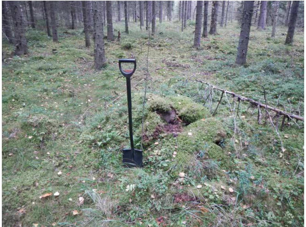
Kuva 41. Yksi kaskiraunioista kuvattuna kaakosta.