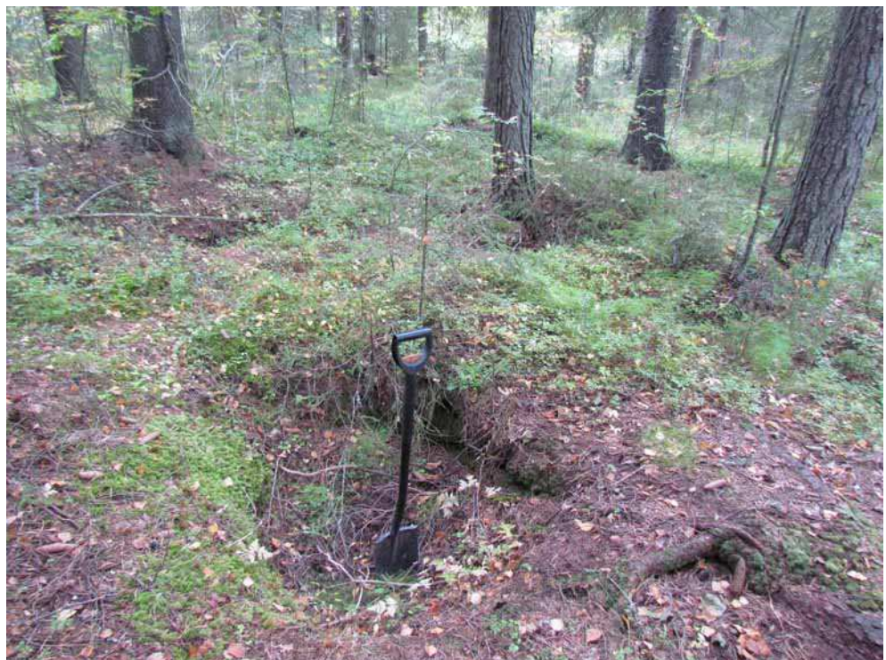
Kuva 28. Pohjoisin rakenne eli nelikulmainen kuoppa kuvattuna idästä.