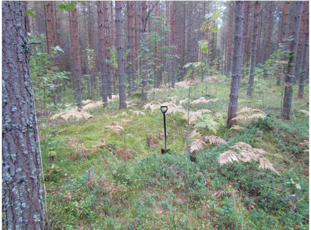
Kuva 25. Itäisin hiilimiilu kuvattuna idästä.