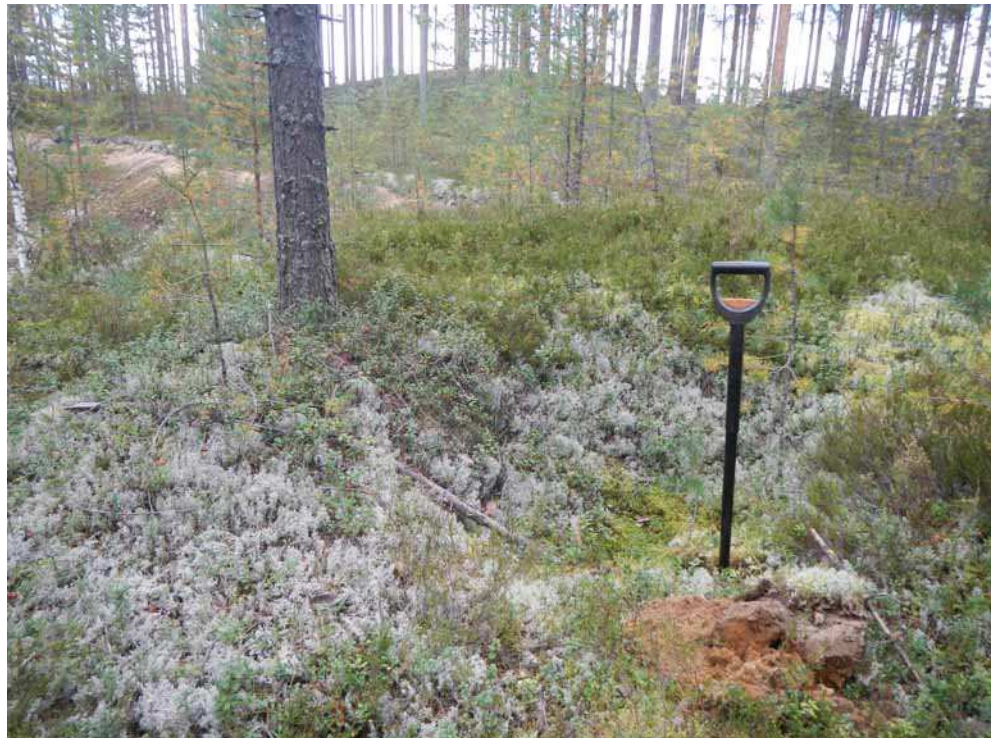
Kuva 38. Inganlammen painanne kuvattuna lounaasta.