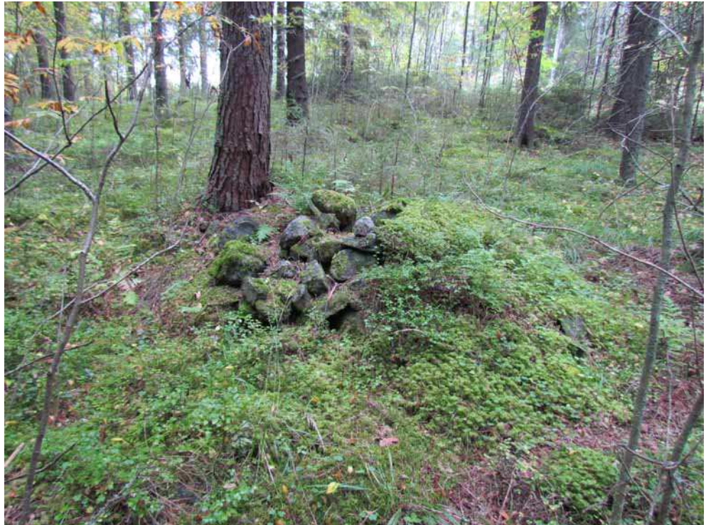
Kuva 29. Yksi kohteen suurimmista kaskiraunioista kuvattuna lounaasta.