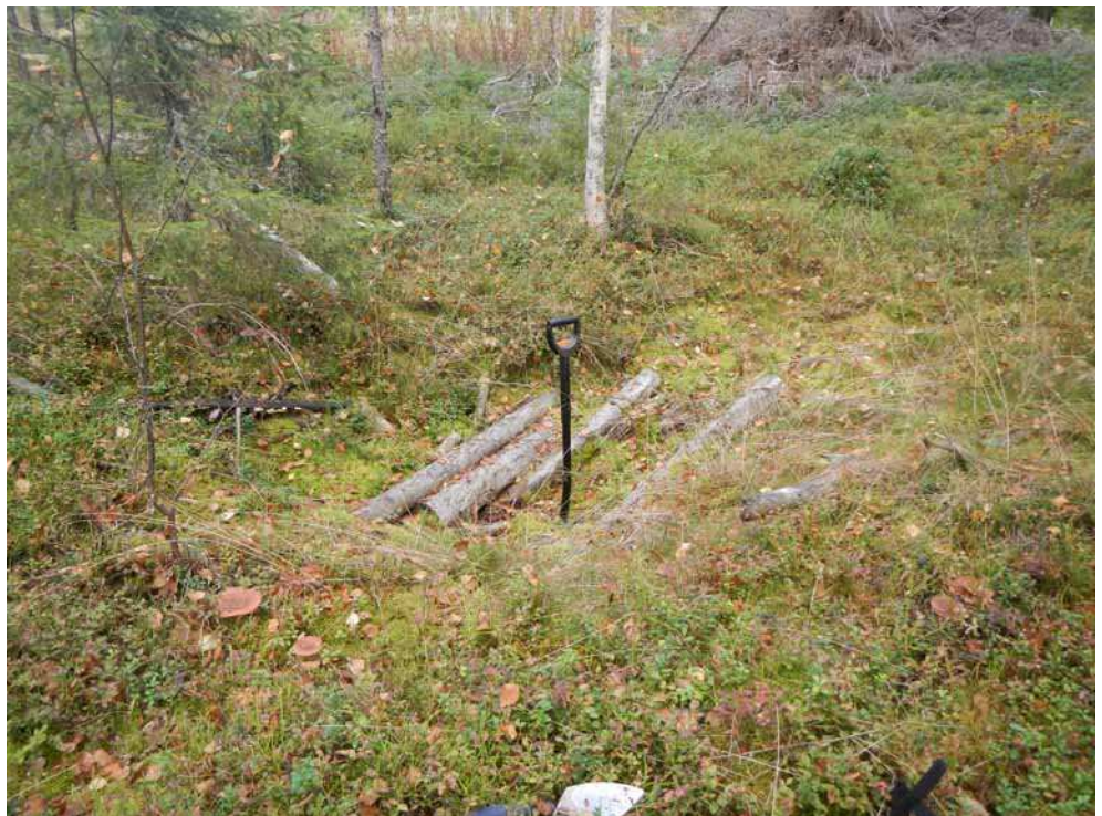
Kuva 47. Painanne B kuvattuna etelästä.