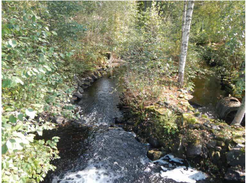
Kuva 49. Myllyn rakenteita kuvanttuna pohjoisesta.