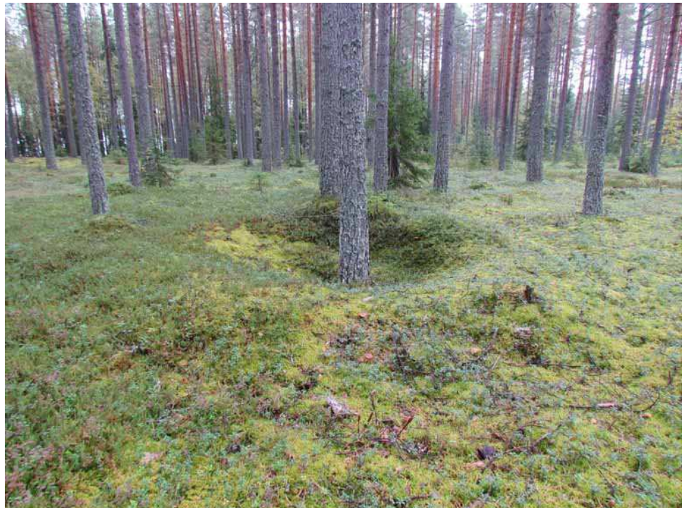
Kuva 4. Hiilimiilu 2 kuvattuna pohjoisluoteesta.