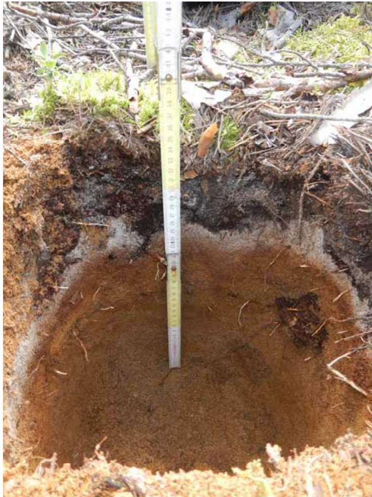
Kuva 36. Tinkinlammen pohjukassa sijaitsevaan painanteeseen kaivetun koekuopan maannos.