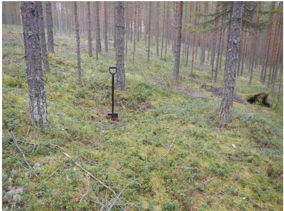
Kuva 45. Painanne B kuvattuna etelästä.