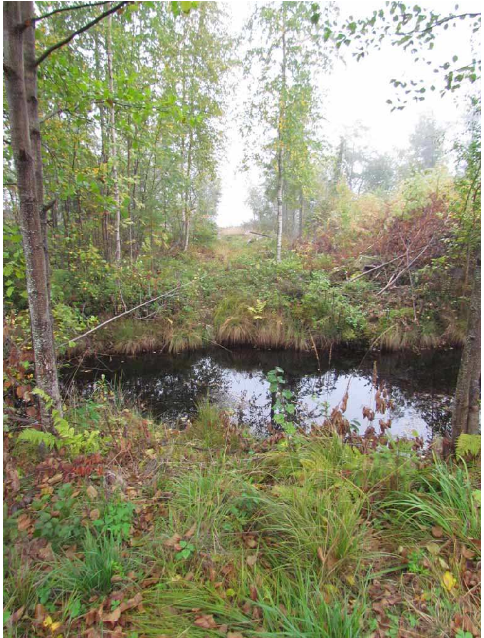
Kuva 56. Veneenvetopaikkaa kuvattuna lännestä.