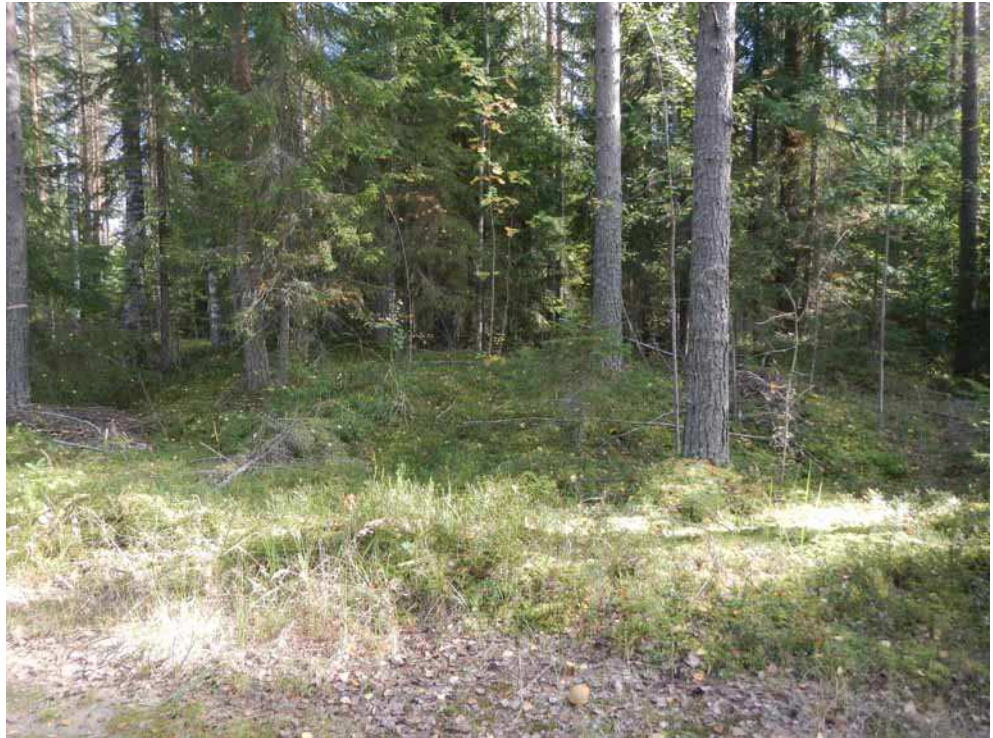
Kuva 32. Tervahauta A kuvattuna luoteesta.