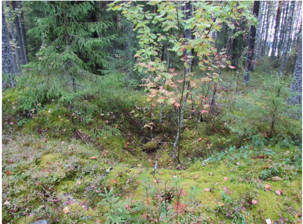
Kuva 22. Vuoden 2013 inventoinnissa löydetty uusi hiilimiilu kuvattuna lounaasta.