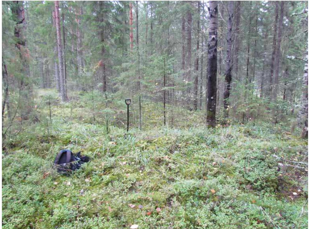
Kuva 15. Tervahauta 3 kuvattuna lounaasta. Lapio haudan vallin reunalla.