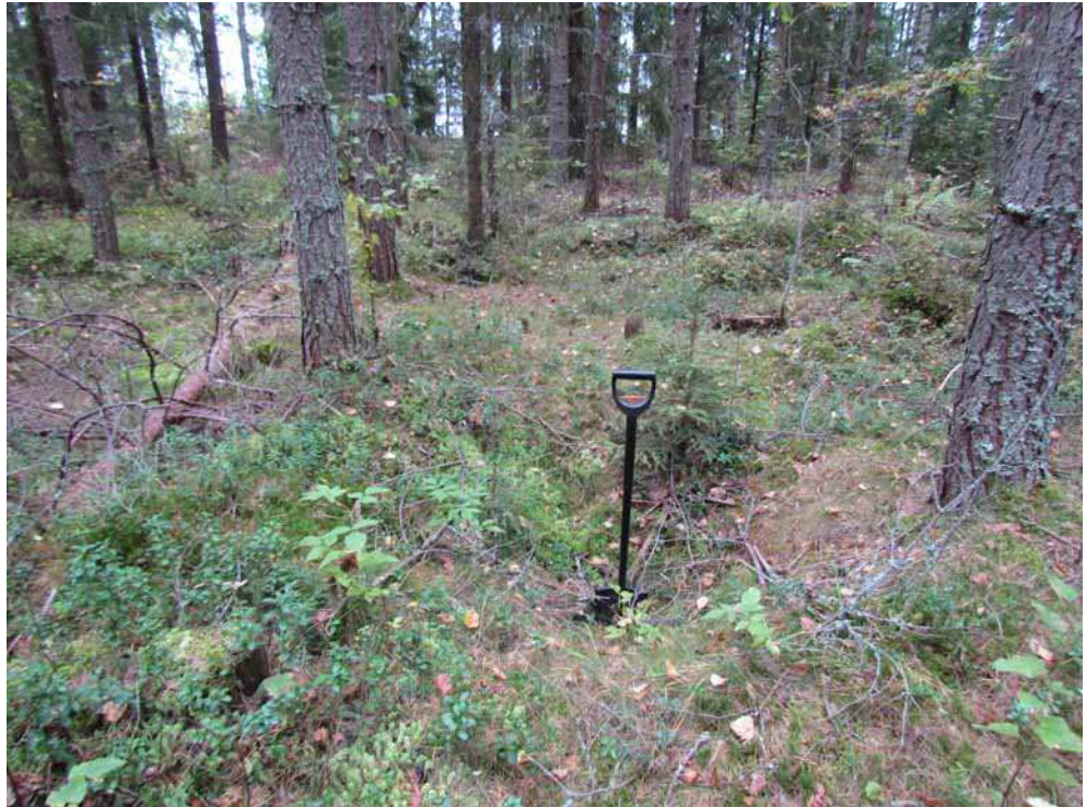
Kuva 24. Tyypillinen pieni miilu kuvattuna tässä luoteesta.