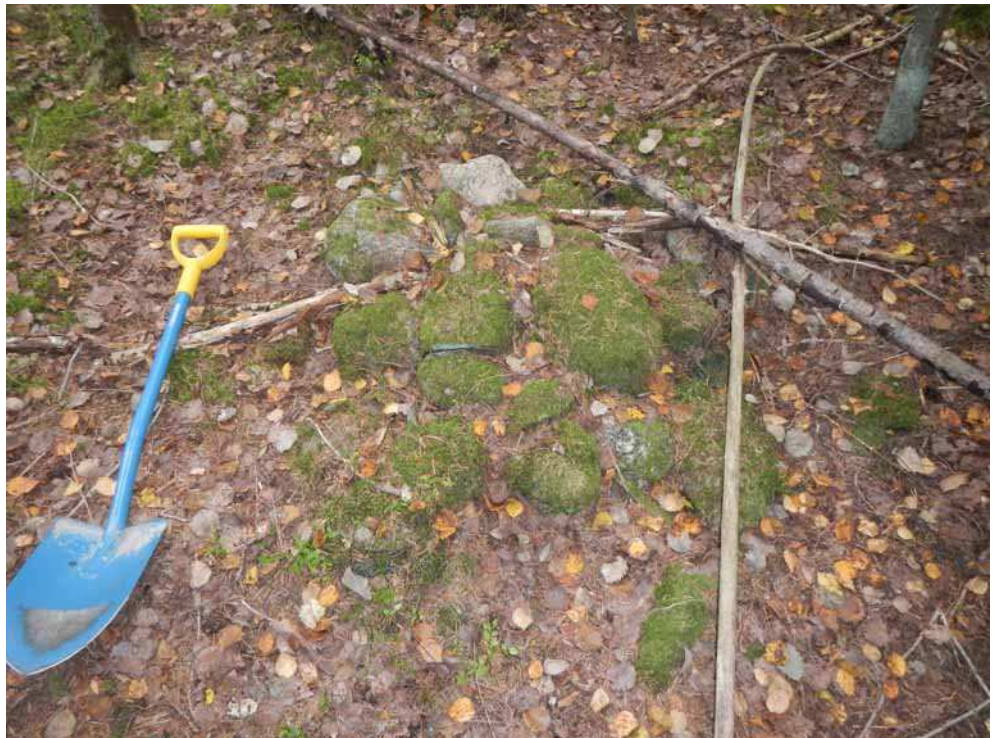
Kuva 54. Röykkiö E, lapio mittakaavajana vieressä.