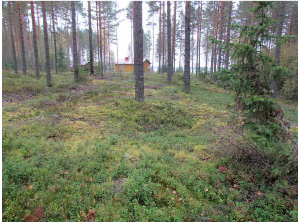
Kuva 8. Painanne kuvan keskellä kuvattuna luoteesta.