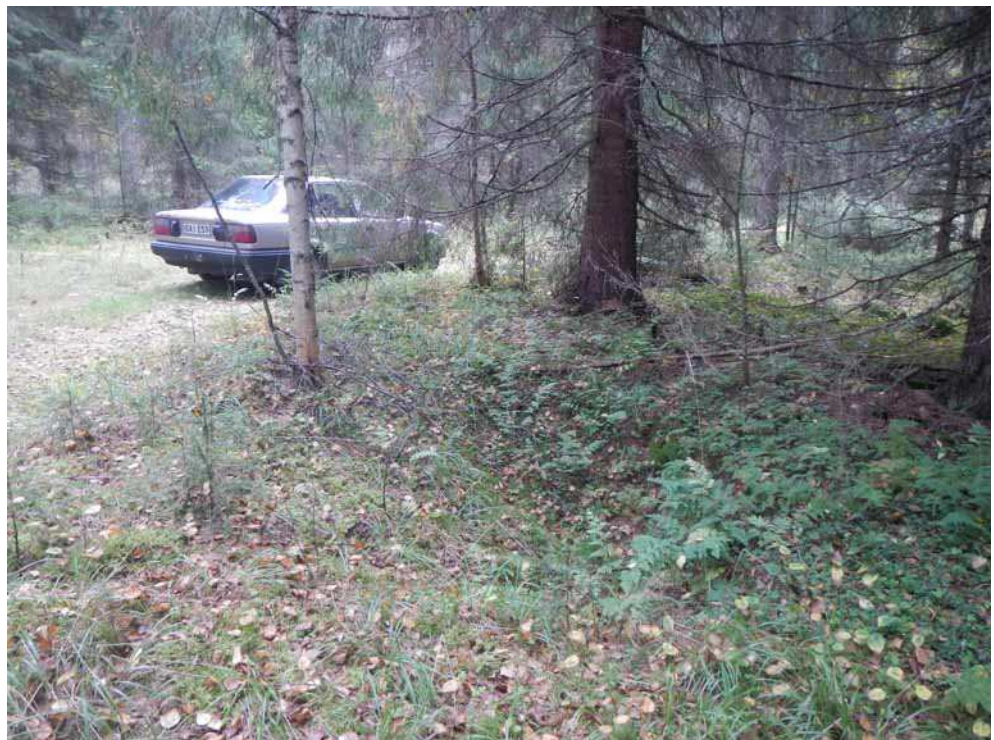
Kuva 40. Nauriskuoppa A kuvattuna pohjoisesta.