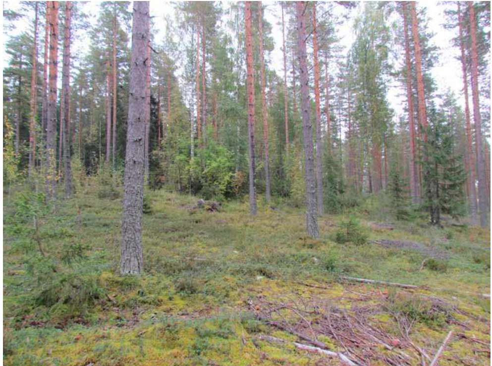
Kuva 7. Tervahauta ja sen ympäristöä kuvattuna lounaasta. Tervahauta pensaikossa kuvan keskellä ylärinteessä.