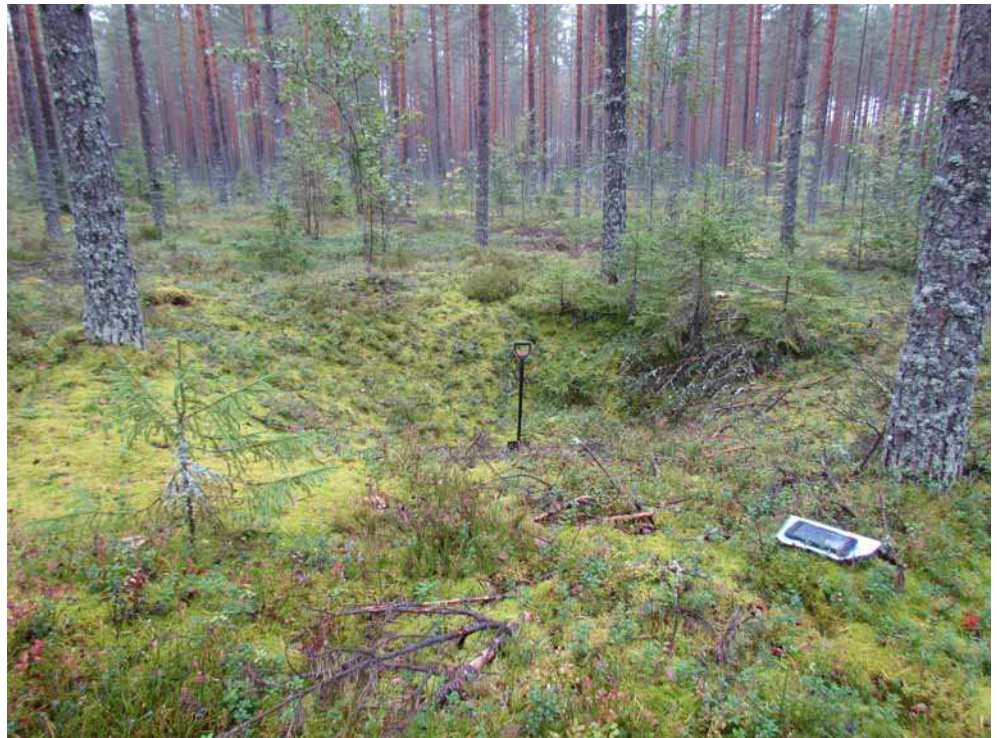
Kuva 3. Hiilimiilu 1 kuvattuna lounaasta.