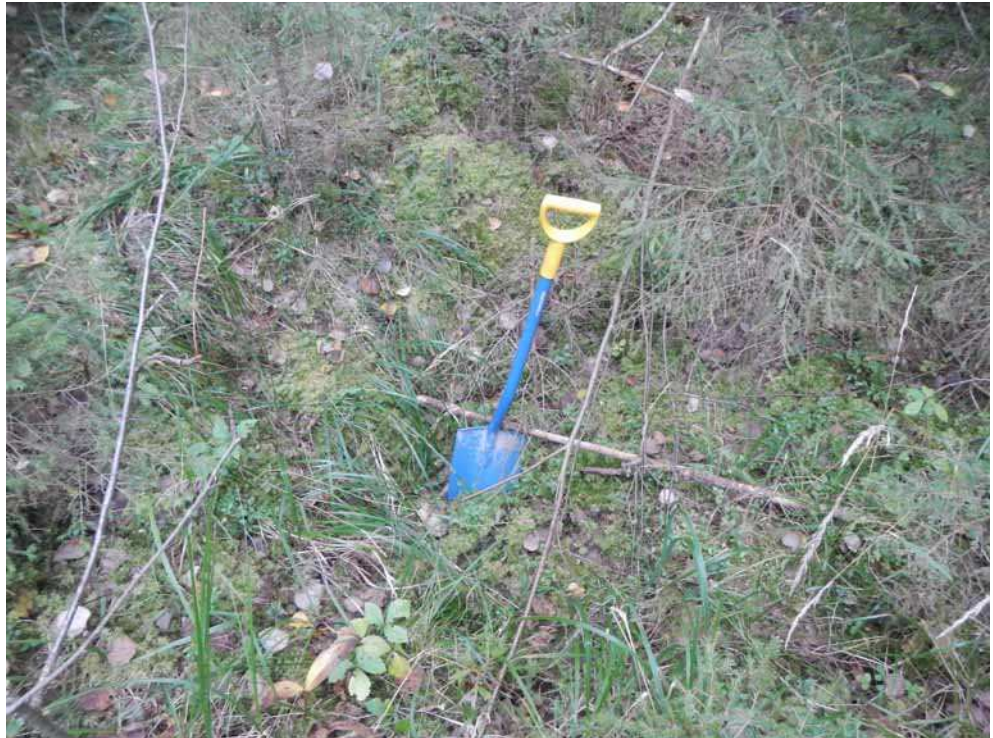
Kuva 51. Kuoppa B.