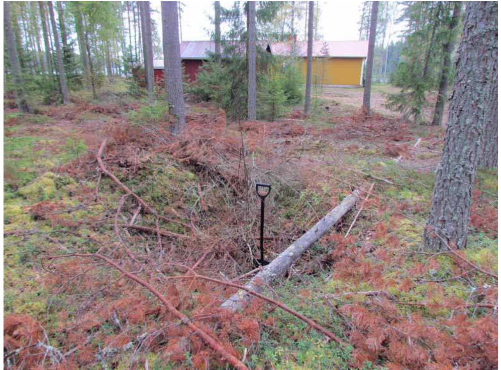
Kuva 2. Mahdollinen säilytyskuoppa 1 kuvattuna pohjoisesta.