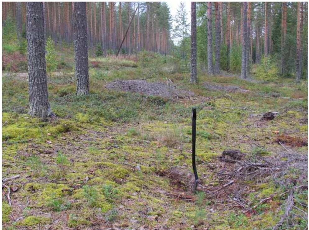
Kuva 31. Painanne kuvattuna etelästä, lapio painanteen keskellä. Vasemmalla kuvan reunassa StoraEnson kämpälle vievä hiekkatie.