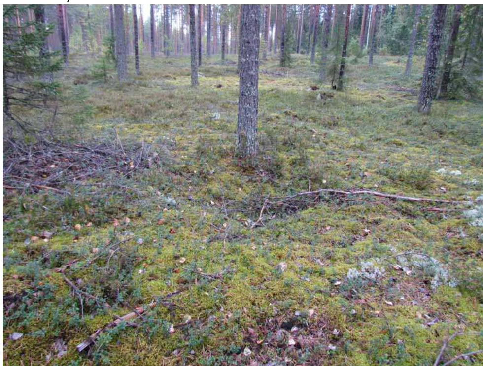
Kuva 30. Painanne kuvattuna etelästä.