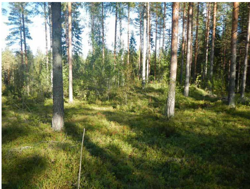
Kuva 39. Tervahauta kuvattuna lännestä.