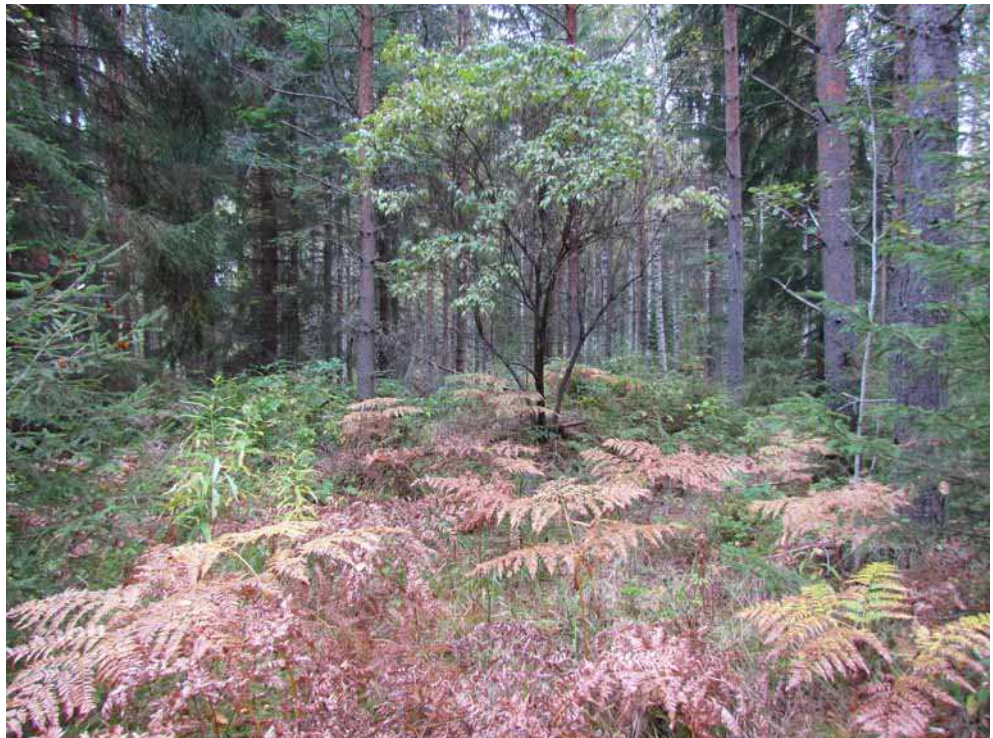
Kuva 27. Osittain tuhoutunut tervahauta kuvattuna itäkaakosta.