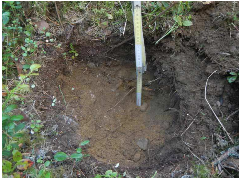
Kuva 20. Tyypillinen maannos Ojinniemen kivistä asuinpaikalla. Kunnonhuhuttoutumiskerrosta ei ollut muodostunut läheskään kaikkiin kuopista.