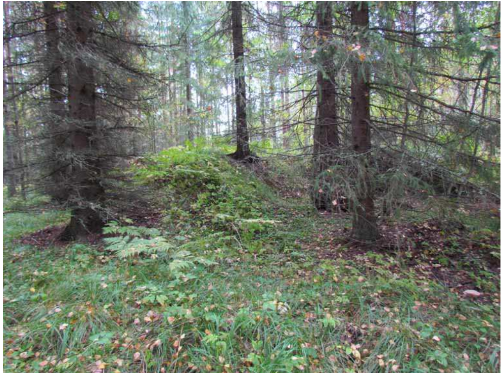
Kuva 11. Rautakuonakasa kuvattuna luoteesta.