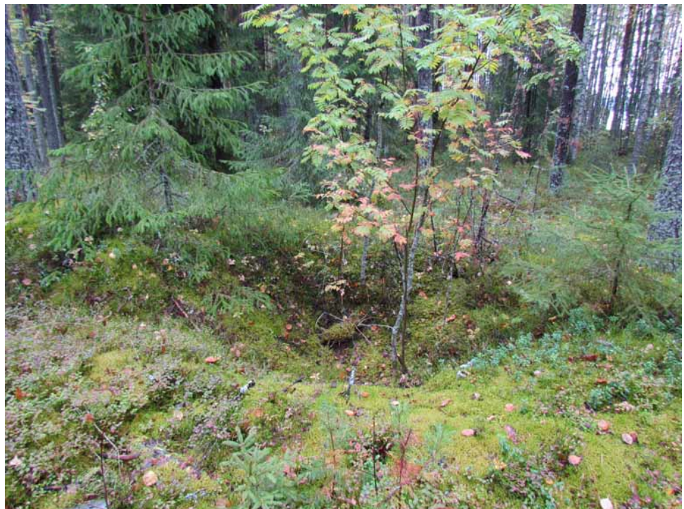
Kuva 5. Mahdollinen säilytyskuoppa 3 kuvattuna lännestä.