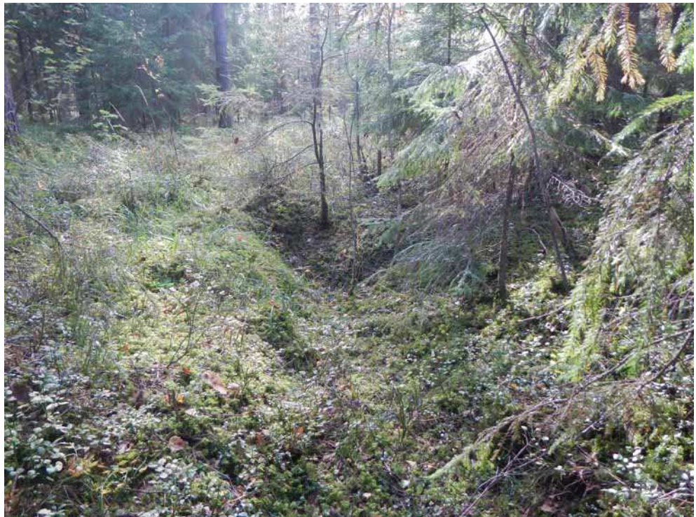
Kuva 33. Tervahauta B:n ympärillä havaittua ojamaista kaivantoa kuvattuna koillisesta.