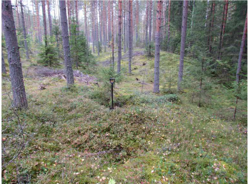
Kuva 13. Mahdollinen säilytyskuoppa kuvattuna itäkaakosta.