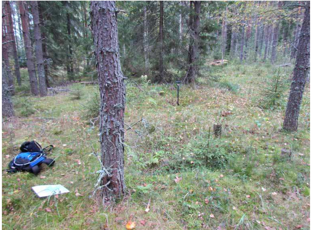
Kuva 27. Kaksi läntisintä kuopannetta, todennäköisesti hiilimiilua, kuvattuna lännestä.