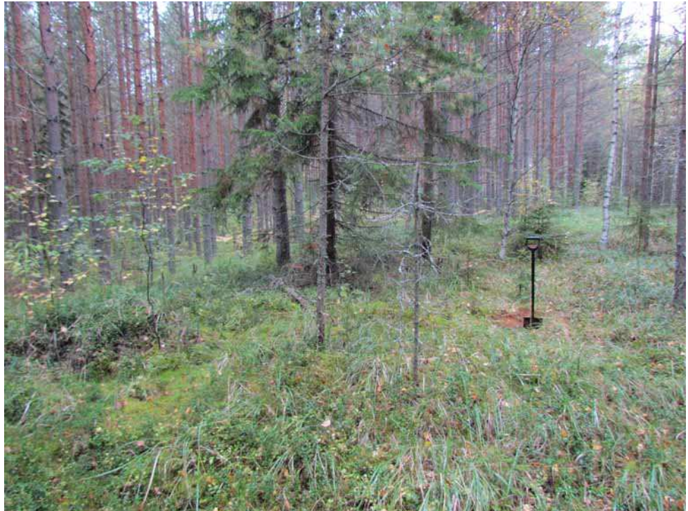
Kuva 1. Hietaniemen kivikautinen asuinpaikka ja sen muinaisrantaterassi kuvattuna lounaasta. Yksi paikalle tehdyistä koepistoista kuvassa olevan lapion kohdalla.