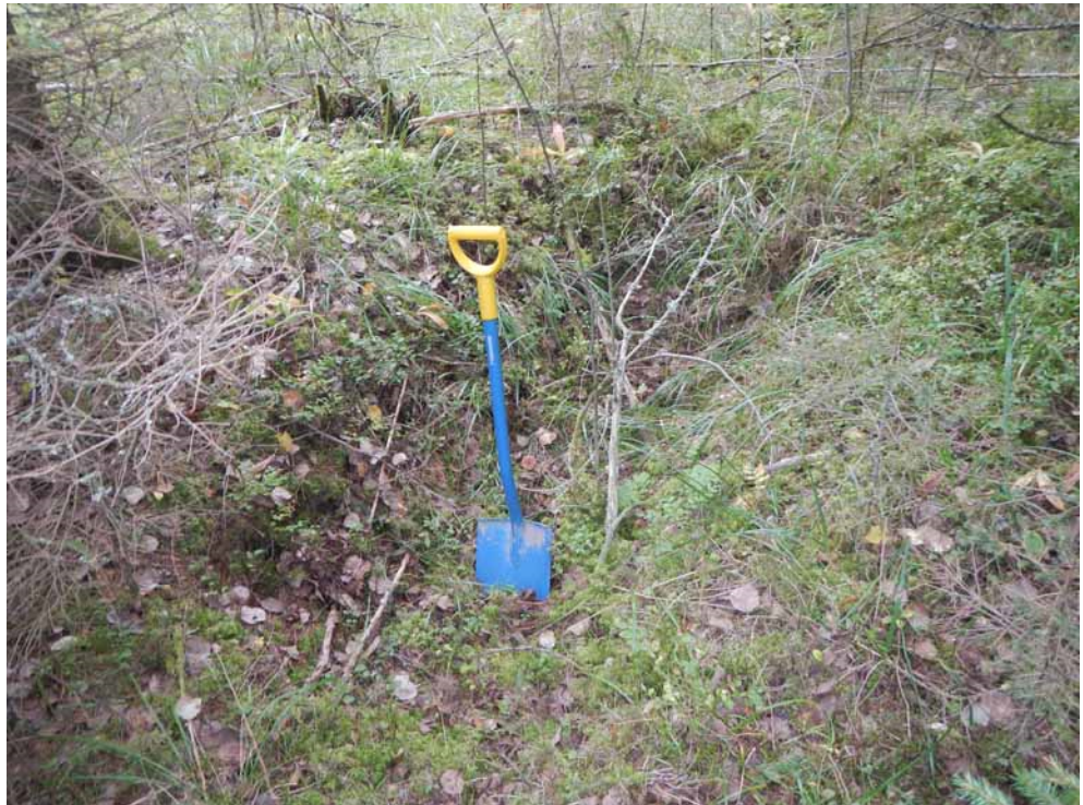
Kuva 50. Kuoppa A, jonka keskellä lapio.