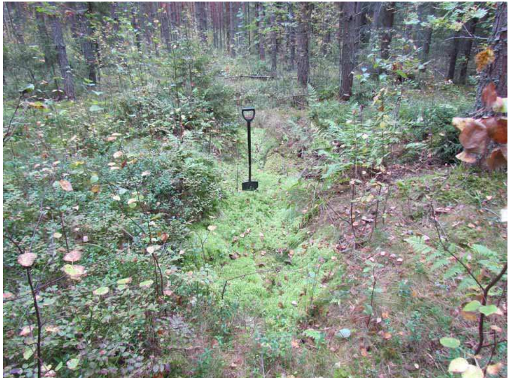
Kuva 23. Suurin hiilimiiluista, pitkänomainen kaivanto, kuvattuna länsiluoteesta.