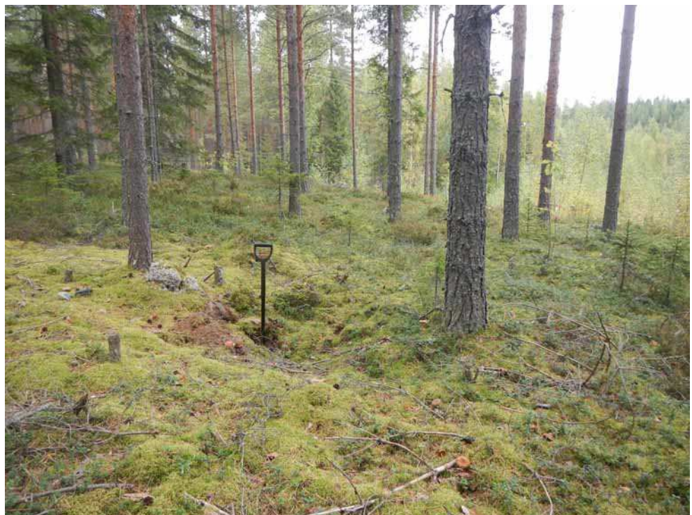
Kuva 43. Painanne A kuvattuna etelästä.