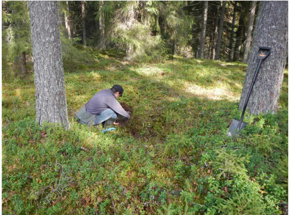
Kuva 46. Painanne A kuvattuna etelästä. Markus Kankkunen tutkii koepiston maannosta.