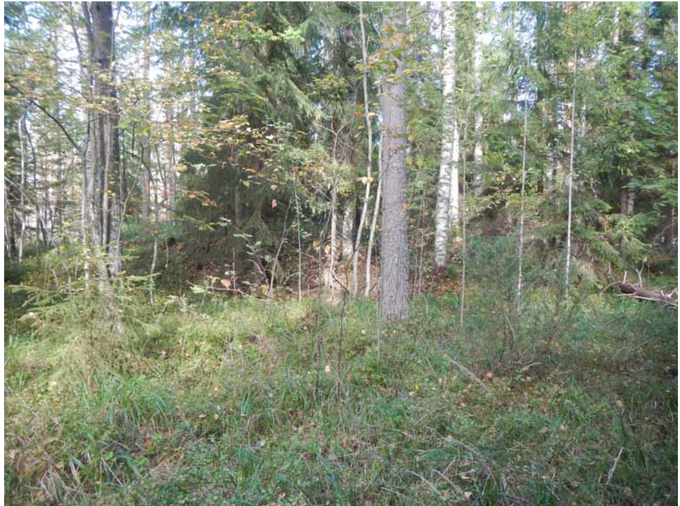
Kuva 34. Tervahauta B kuvattuna idästä.