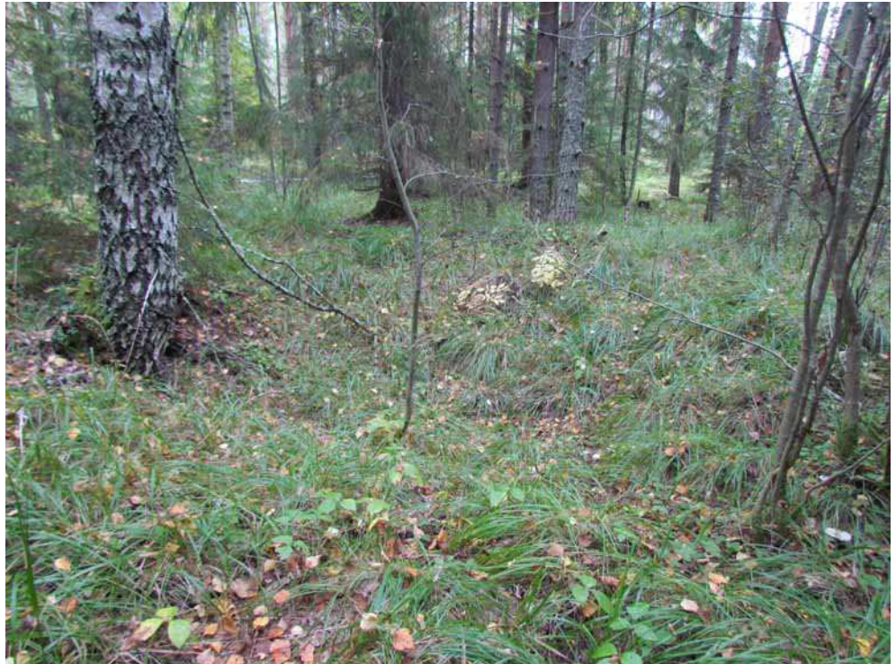
Kuva 9. Toinen itäisimmistä hiilimiiluista kuvattuna lännestä.