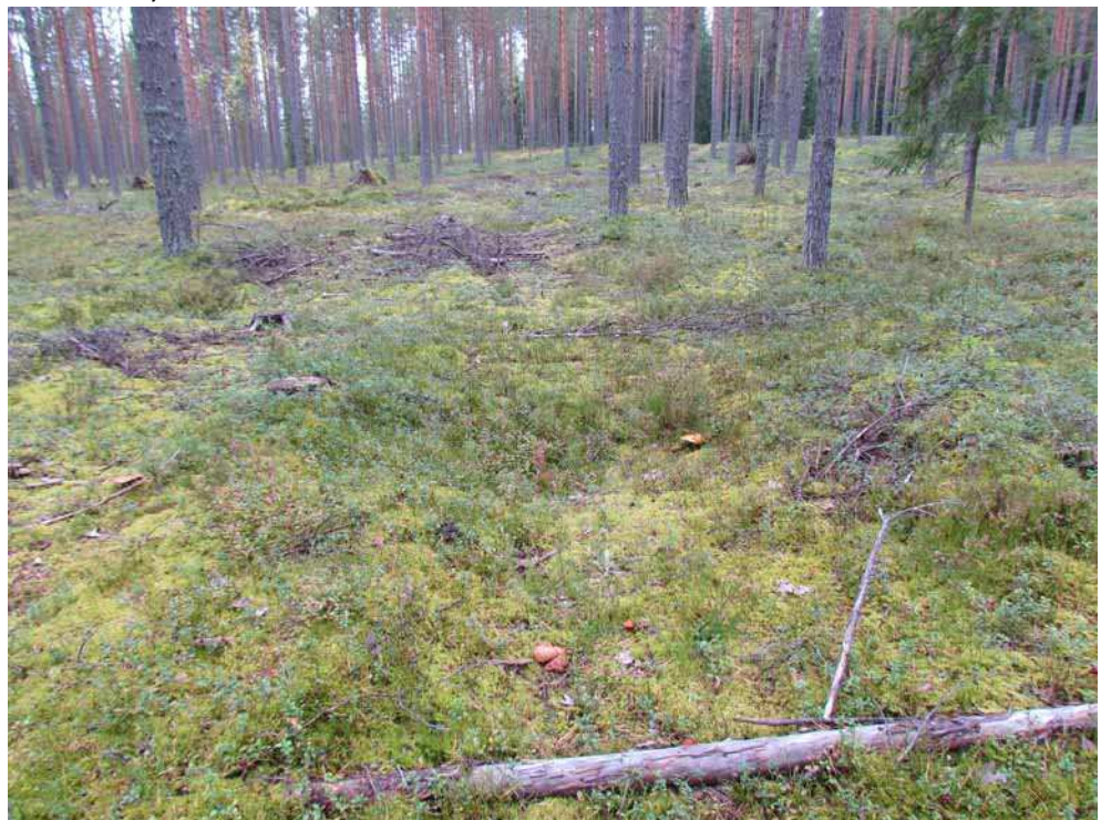
Kuva 17. Mahdollinen säilytyskuoppa 4 kuvattuna koillisesta.