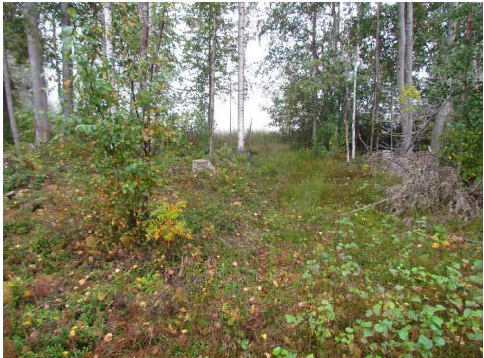
Kuva 55. Veneenvetopaikka kuvattuna idästä. Kohdalla sijaitsee yhä käytössä oleva rajalinja, minkä vuoksi veneenvetopaikan kohtaa on raivattu puustosta.