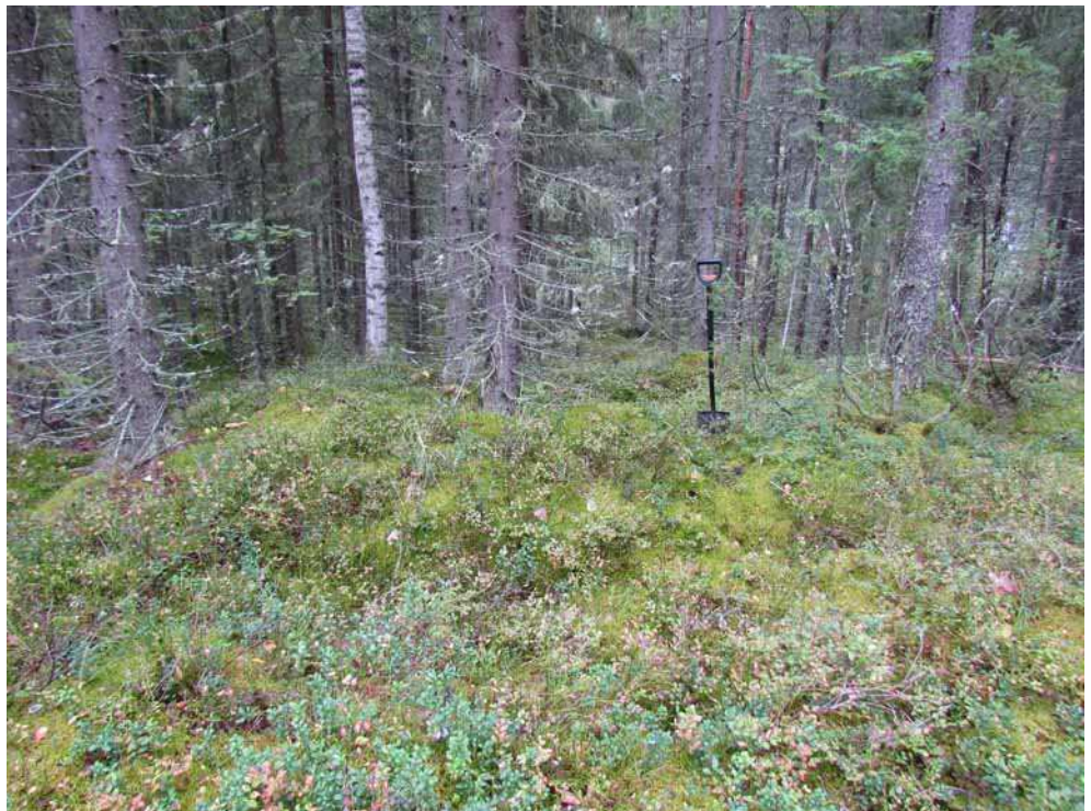
Kuva 14. Tervahauta 2 kuvattuna lännestä. Lappio haudan vallin päällä.