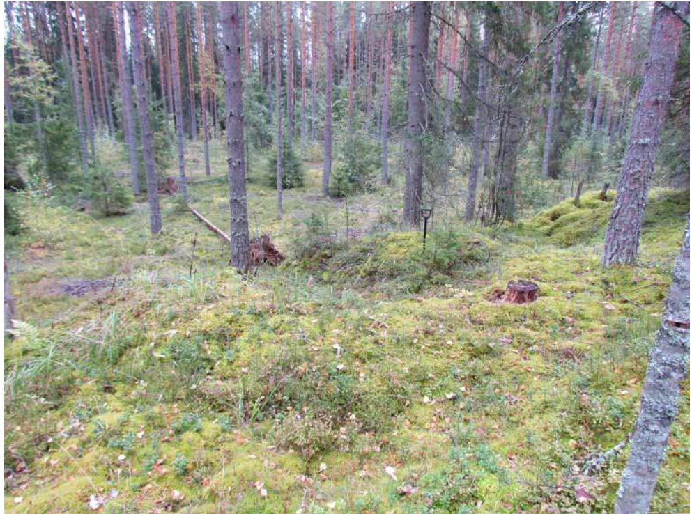
Kuva 18. Tervahauta 1 kuvattuna luoteesta.