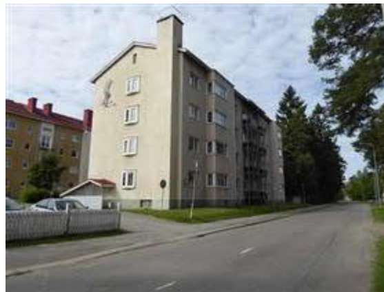
Tahintie 14a asuinkeuhasto.

Rautatiemiljöeseen liittyvä rautatieläisten entinen asuinalue. Alueelle rakennettiin kaksi asuinkeuhastoa vuonna 1950.