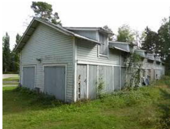
Ratapiirin toimisto- ja asuinrakennuksen piharakennus.

Entinen ratapiirin toimisto- ja asuinrakennus vuodelta 1913.