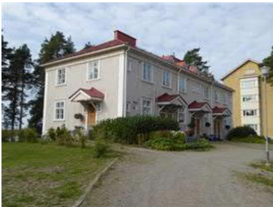
Tahintie 12 asuinrakennus.

Kaksikerroksinen puutalo vuodelta 1926. Talossa on kuusi asuntoa.