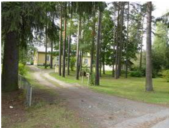
Tahintie 16 asuinrakennus.

Omalla tontillaan rakennusrivin päätteellä on kahden asunnon asuinrakennus vuodelta 1939.