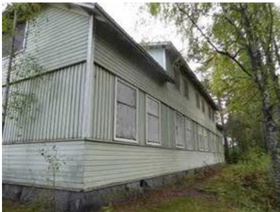
Ratapiirin toimisto- ja asuinrakennus.