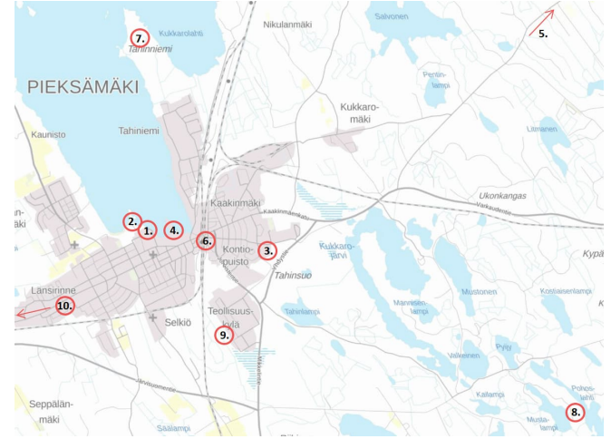
Kuva: Vireillä olevat asema- ja ranta-asemakaavat