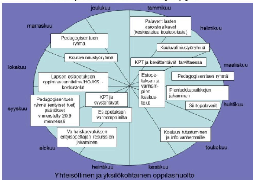
Toisen esiopetusvuoden vuosiympyrä