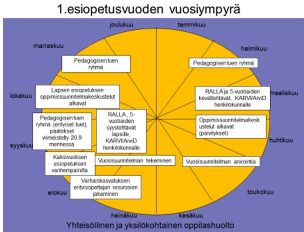
Ensimmäisen esiopetusvuoden vuosiympyrä

[70] Perusopetuslaki 30 § 1 mom. (642/2010)