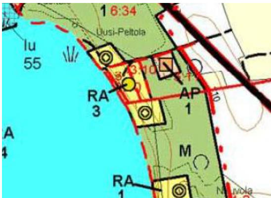
Ote voimassa olevasta rantaosayleiskaavasta

Yleiskaavassa suunnittelualueelle on osoitettu yksi lomarakennuspaikka (RA). Suunnittelualueen pohjois- ja eteläpuolelle on kaavoitettu yhdet lomarakennuspaikat, joita ei ole toteutettu.