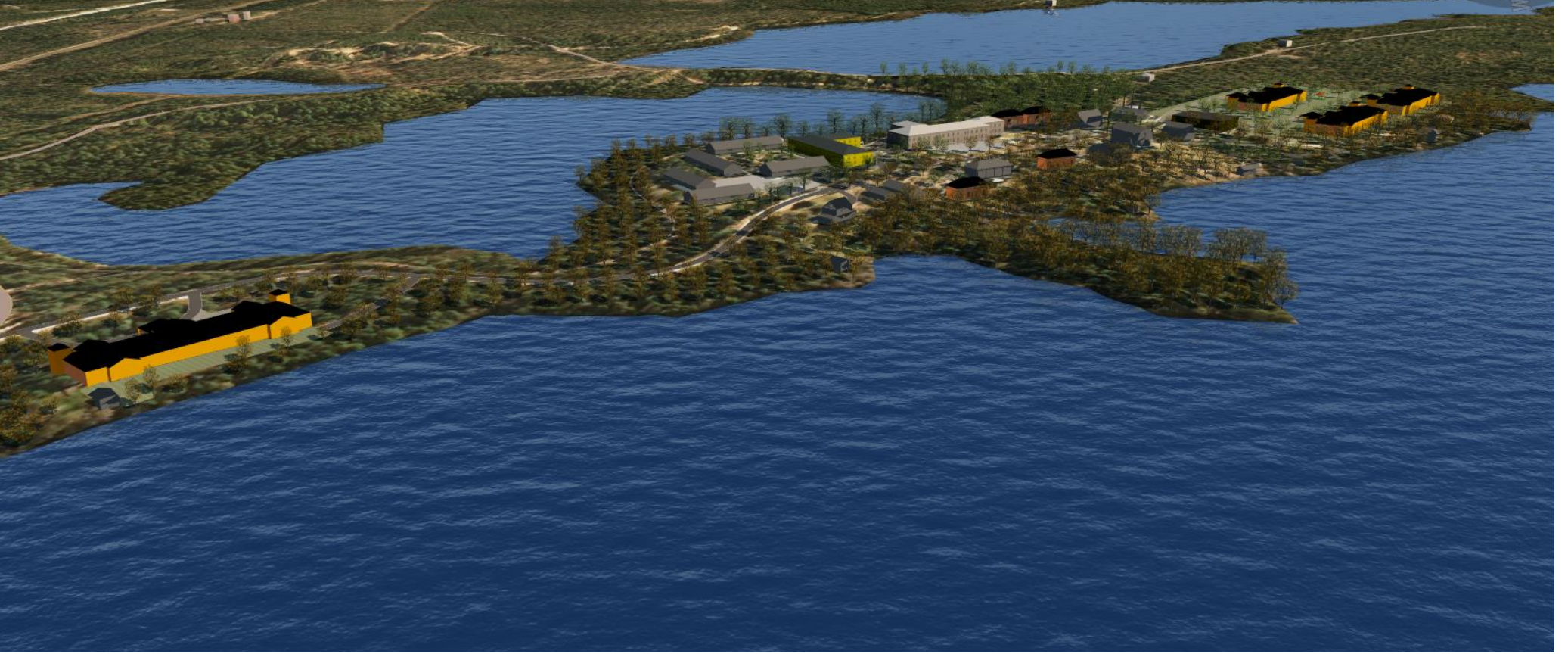
Nikkarilan asemakaava-alue kuvattuna luoteesta. Etualalla korostettu uudelle rakennusalalle sijoittuva rakennusmassa. Varisniemi jää rakentamisesta vapaaksi.