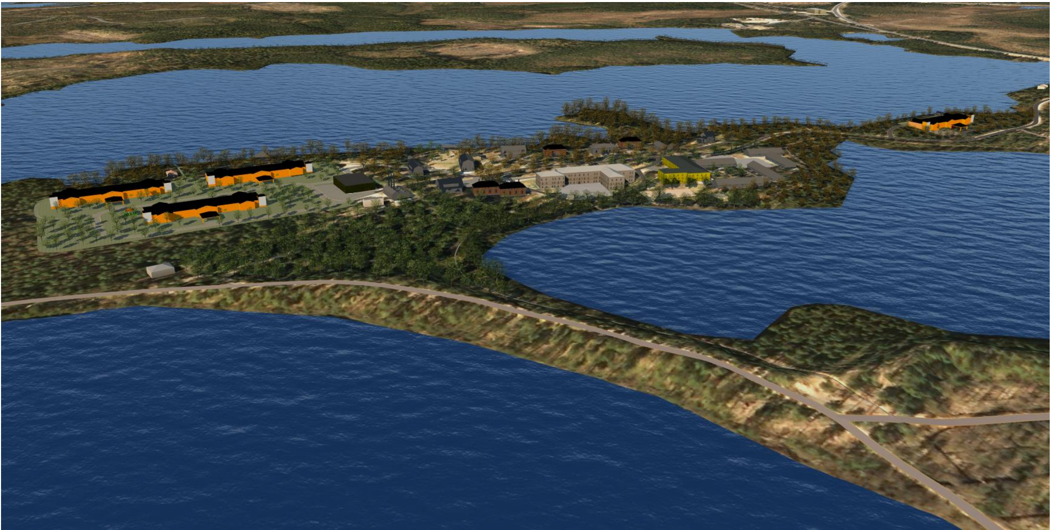
Nikkarilan asemakaava-alue kuvattuna idästä. Kampusalueen vanhan päärakennuksen ja rivitalojen väliin havainnollistettu uudisrakennus, joka on sisäpihan puolelta II-kerroksinen ja Hautosen lammen puolella III-kerroksinen.